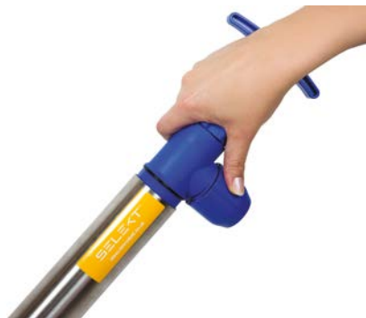
Stap 5 Monteer de pomp weer. Draai het bovenstuk niet te strak aan, dit kan leiden tot verzwakking.