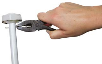
Stap 3 Verwijder de splitpen van de pompstang en vervang de pompstang, pompstangring of met teflon beklede ring. Voor het vervangen van de pompstangring eerst de pompstangkoppeling losschroeven.