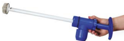
Stap 2 Verwijder de pompstang met bovenstuk en met teflon beklede ring.