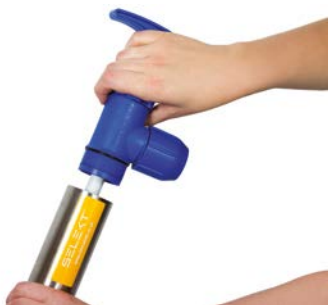
Stap 1 Schroef het bovenste stuk los.