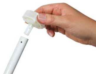
Stap 4 Monteer de met teflon beklede ring en plaats een nieuwe splitpen.